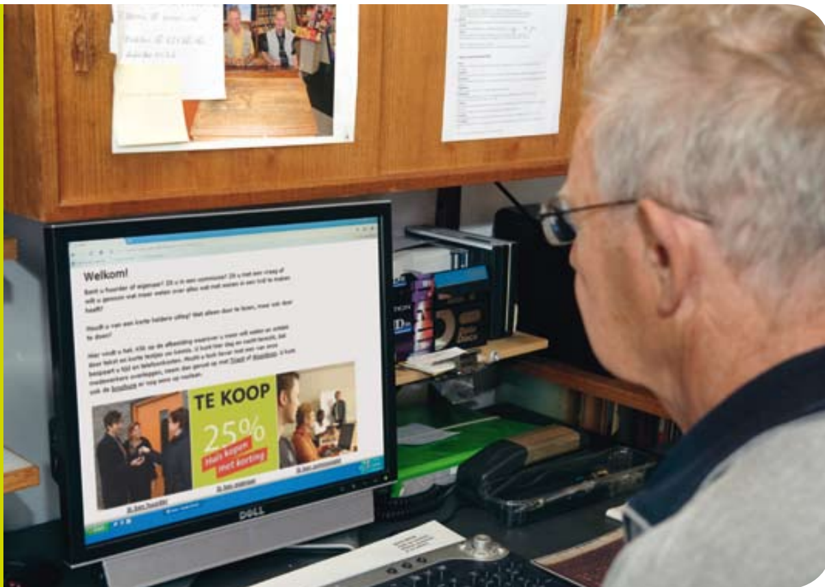
Wegwijs in de VvE vanuit huis