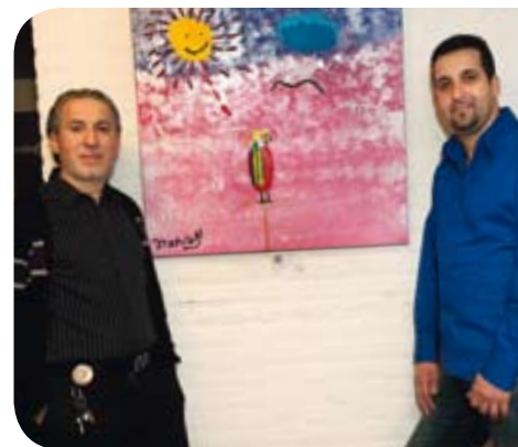
Marokkaanse Vaders nuanceren het beeld in de wijk