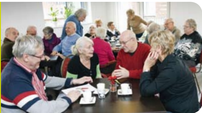
Koffiedrinken in de Oase, de gezamenlijke huiskamer van woonvereniging Oedenvliet.