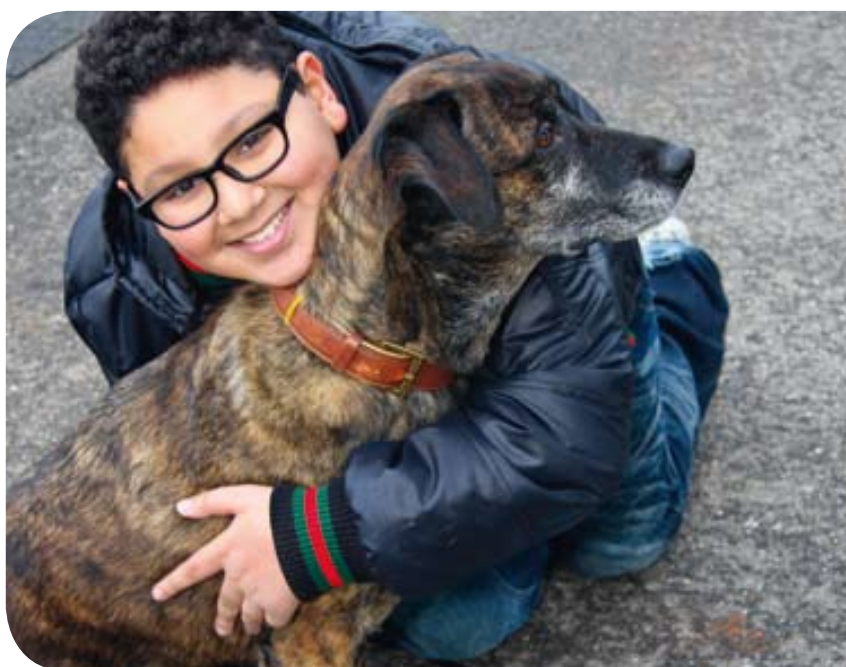
Zo ben ik - pagina 22