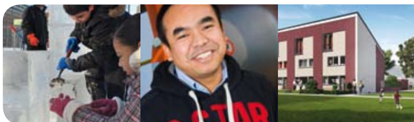
Winterfestijn - pagina 9