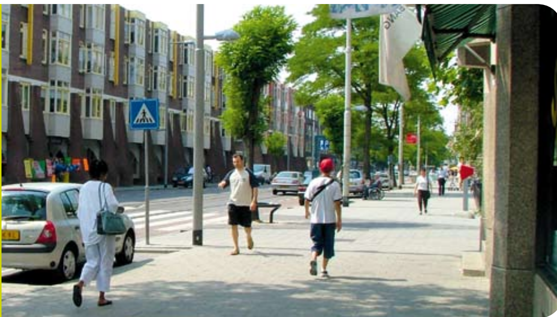
Nieuwe regels in woningtoewijzing

Hoge inkomens krijgen geen sociale huurwoning meer