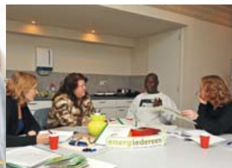
De energiecoaches zijn er klaar voor