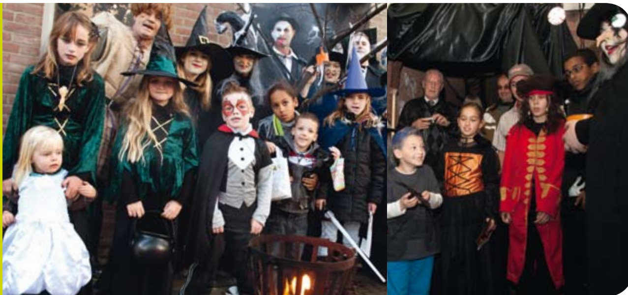
Team Beverwaard en de kinderen van Beverwaard genoten van de Halloweenmiddag