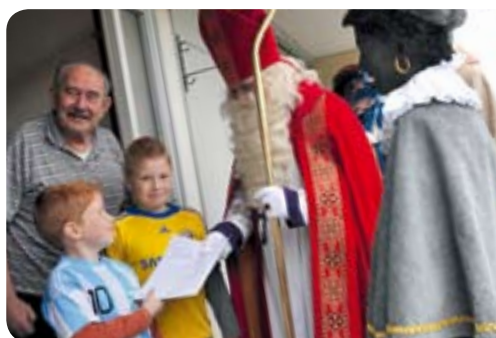
De Fledderusbuurt kreeg hoog bezoek

Meedoen is goed voor de portemonnee èn goed voor het milieu. Meer weten over de verschillende energieprojecten van Woonbron? Kijk dan op www.energieslim.nl ■