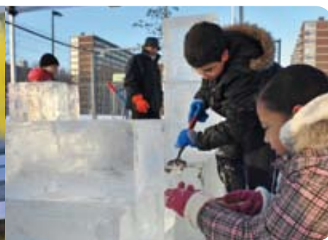
Winterfestijn: Bewoners maakten kennis met het ice carven