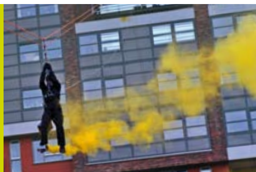
Een kleurrijk rookgordijn markeert de start bouw van Amber

Dat het nu al goed toeven is in Poptahof, blijkt uit het succes van het driedaagse winterfestijn dat in december in het Poptahof plaatsvond. Deze activiteit werd georganiseerd door de stichting Popta! Cultura Bunta, die vooral uit bewoners en ondernemers bestaat. Dit jaar stond het thema 'Bewegen' centraal. In de grote tent in het Poptahof waren er winterspelen en een muzikaal programma met optredens van onder andere Guus Westdorp en Henk de Kat. Ook werkte een ijskunstenaar aan een ijssculptuur van de nieuwbouw AMBER. Liefhebbers konden zelf ervaring opdoen met het 'ice carven'. En bij de creatieve ondernemers van Broedplaats Poptahof kon iedereen aan de slag met verschillende workshops. Poptahof bruist! ■