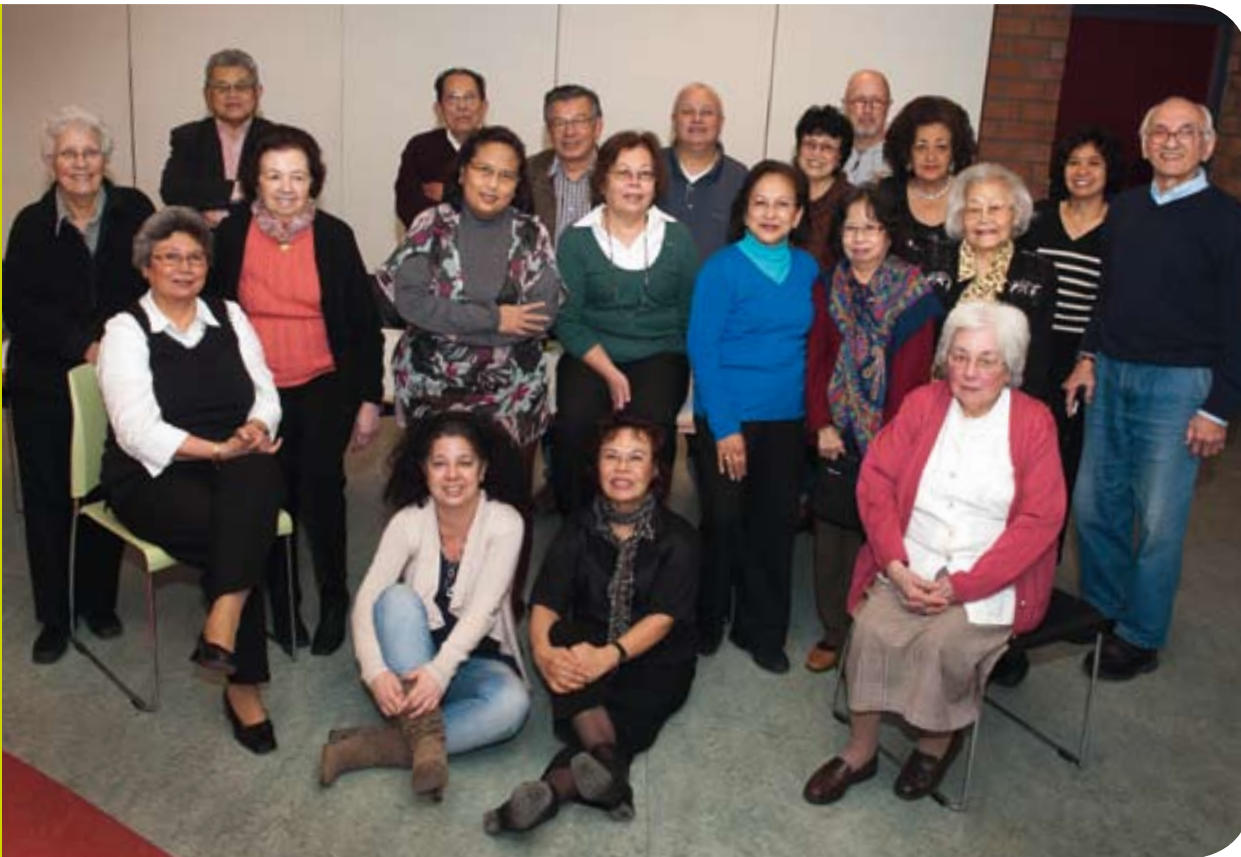
Leden van de Indische woongroep Rumah Oost-West hechten veel waarde aan de Indische cultuur en wonen graag met gelijkgestemden