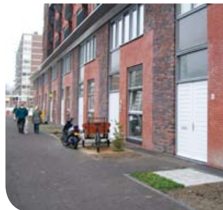
Een voorbeeld van de bedrijfsruimten die via Woonbron Makelaars wordt verhuurd in Delft is de Taj Mahalplaats in Poptahof. Een plaats voor creatieve ondernemers die zich inzetten bij de vernieuwing van de wijk.