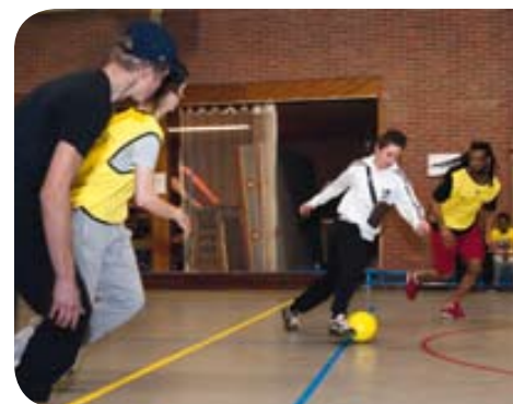
Sportinloop in Zevenkamp

jongeren, de deelgemeente verzorgt de gymzaal, Sport en Recreatie de sportmaterialen en de kennis en Woonbron levert een financiële bijdrage. ■