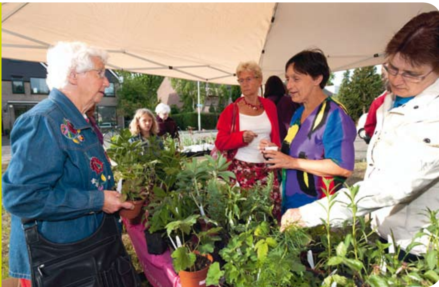
Kiezen uit vele bijzondere planten bij de plantenruilbeurs in de Grasbuurt