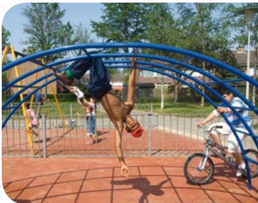
Samen kom je verder dan alleen - pagina 4