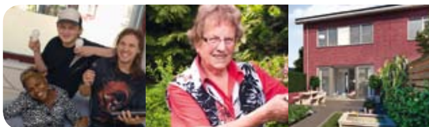
Energie Battle - pagina 13