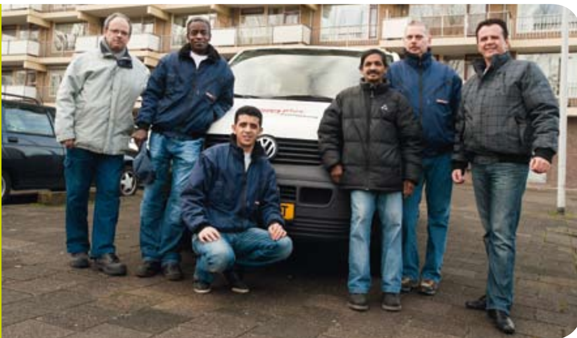
De mannen van Service Plus

papiertje liggen zoals hier, maar er zullen vast ook wel eens kleinkinderen op bezoek komen bij opa en oma." Hij doet het werk al twintig jaar. "Nee, geen dag hetzelfde. Het is de omgang met de mensen die het elke keer weer leuk maakt. Als complexbeheerder doe je echt van alles. Hier een lampje vervangen, daar een gootsteen ontstoppen. Ja, dankbaar werk is het. Mensen waarderen het werk echt." ■