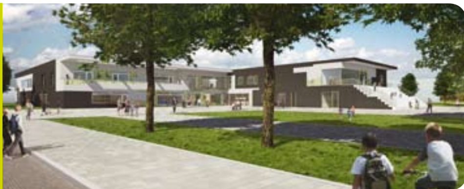
De nieuwe multifunctionele accommodatie in de wijk Oudeland

De initiatiefnemers van de MFA zijn de deelgemeente Hoogvliet, de Dienst Jeugd Onderwijs en Samenleving, Plein nul 10, de kinderopvang en Woonbron. Zij geloven dat het MFA bewoners nieuwe kansen biedt en de buurt aantrekkelijk maakt voor nieuwe bewoners. ■