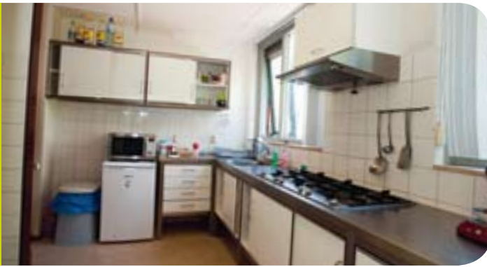
De nieuwe professionele keuken kan jaren mee