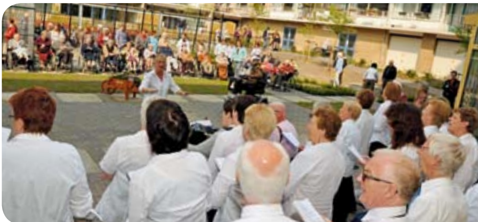
De binnentuin was het fraaie decor van dit mooie afscheid

tatie gemaakt: puinstukken van smakelijke chocolade. Ze werden door leerlingen van basisschool De Horizon uitgedeeld. Meteen een goede kennismaking met de bewoners, want zij gaan straks voor deze ouderen de voortuinen onderhouden. Tot slot lieten zij prachtige, zelfgekweekte vlinders vrij. Deze koolwitjes staan symbool voor het begin van de nieuwe Die Buytenweye. ■