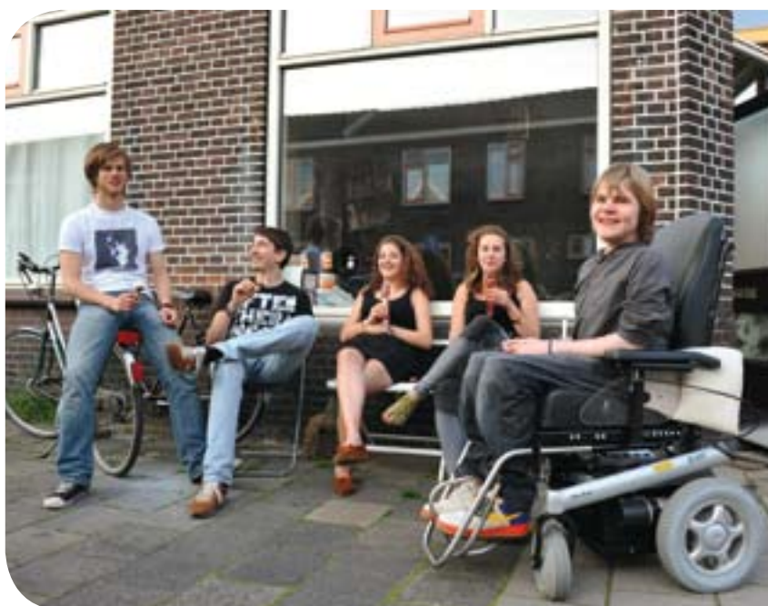
Zo woon ik - pagina 6