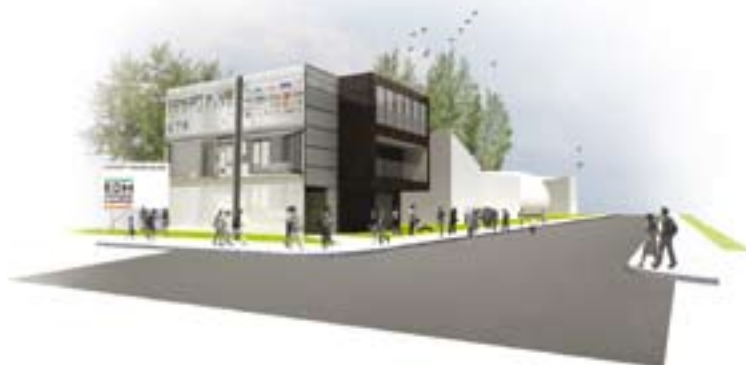
Impressie mogelijke invulling concept house village.

Met de sloop in mei-juni van 46 woningen in het nieuwe dorp wordt de weg vrijgemaakt voor de tijdelijke plaatsing van Concept Houses. In de eerste fase gaat het om zes blokken: Acturuspad 1-6, Ampenanstraat 17-23, Ampenanpad 1-7, Corydastraat 24-46 en 9-27 en de Van Kinsbergenstraat. De Concept Houses staan er tijdelijk. Na een aantal jaren worden ze gedemonteerd.