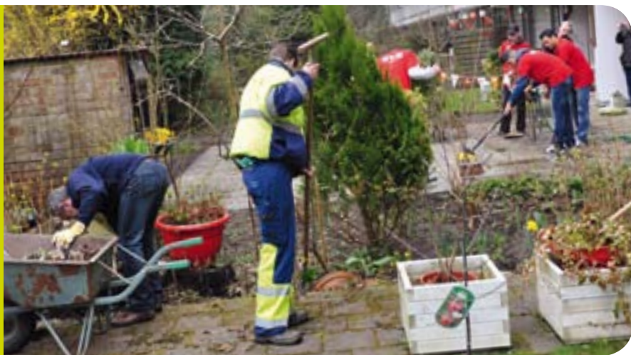
Handen uit de mouwen tijdens NL Doet