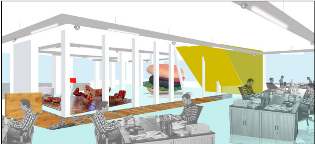
Sfeerimpressie van 'Het Buro'.

Een bewoner attendeerde ons er op dat er vleermuizen bij het gebouw zijn gesignaleerd. Aangezien dit een beschermde diersoort is, heeft Woonbron een onderzoek laten uitvoeren. Uit het onderzoek blijkt dat er in het gebouw geen vleermuizen aanwezig zijn. Wilt u het volledige rapport inzien dan kunt dit rapport opvragen bij Aliën van der Haar, projectleider Nieuwe Westen Woonbron Delfhaven, telefoon 06 100 28 371 of via avdhaar@woonbron.nl .