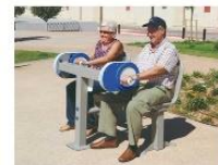
Fitness toestel Dubbele armfiets