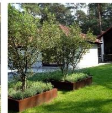
Cortenstaal - verhoogde border