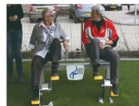
Fitness toestel Dubbele pedalen