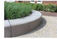
Beton - zitlementen